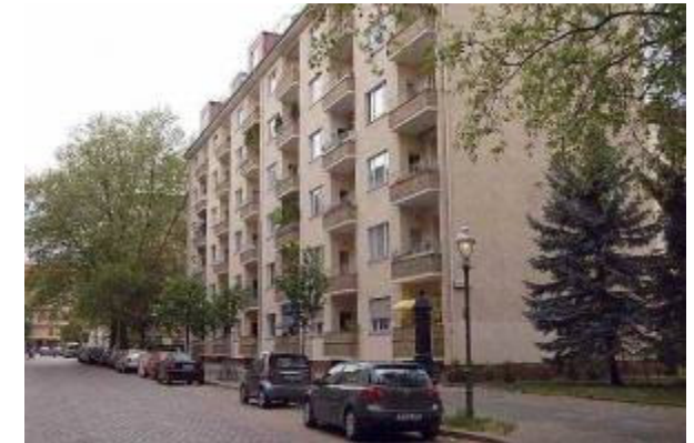
Melanchthonstraße 10 10557 Berlin (Tiergarten)